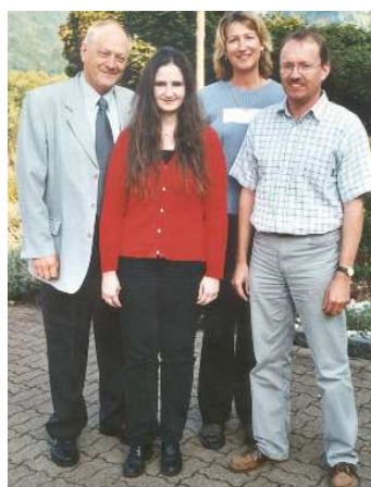
Das Gewerbe-Team von links nach rechts: